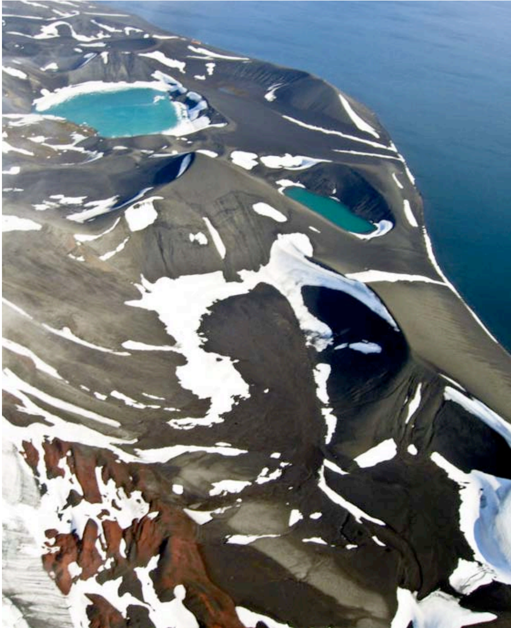
Der abgeschmolzene Gletscher hinterlässt Geröllfelder und Seen.