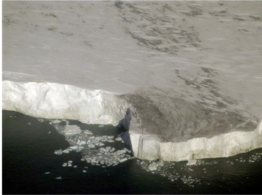
Abbildung 13: An der Schelfkante bildet sich ein Riss aus, an dem der nächste Eisberg abbrechen wird.

Riveras Kartierungs-Systematik setzt auf mehreren Ebenen einen neuen Maßstab für die Klimaforschung.