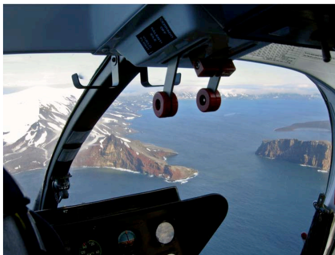
Abbildung 3: Erkundungsflug über Deception Island

Für den Betrieb des Tracking Systems dienen Satellitenbild-Serien von ASTER und Landsat ETM+, die in den Jahren 1986-2006 aufgenommen wurden. Die kontinuierliche Veränderung der letzten 20 Jahre ist somit in einheitlichen Bildern erfaßt worden, was erstmalig dafür sorgt, dass die Bewegungszyklen der Gletscher räumlich und zeitlich auf einer größeren Skala erfassbar wurden. Die Interpretation der